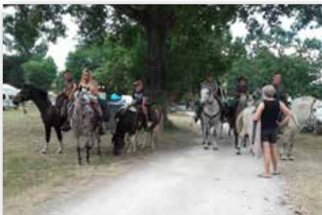
Arrivée à St-Aigulin