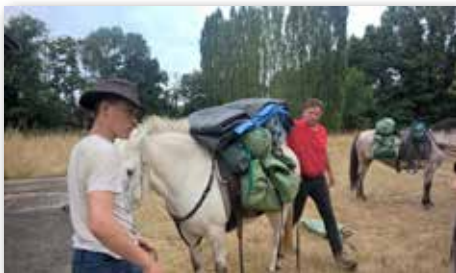
Préparation du cheval de bât