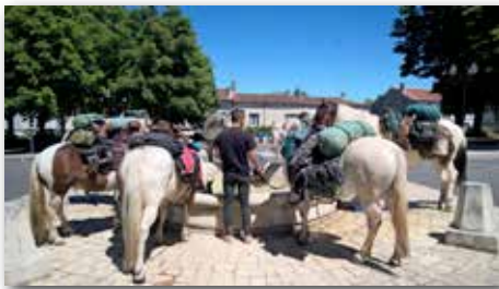
Il fait chaud .....

Article Sud Ouest du 18/07/2016 en Page 4