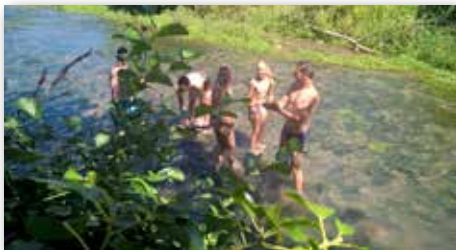
..... pour tout le monde