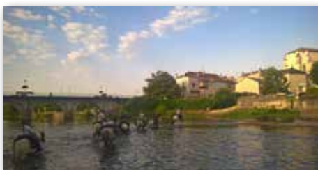
Traversée de la Dronne a St Astier