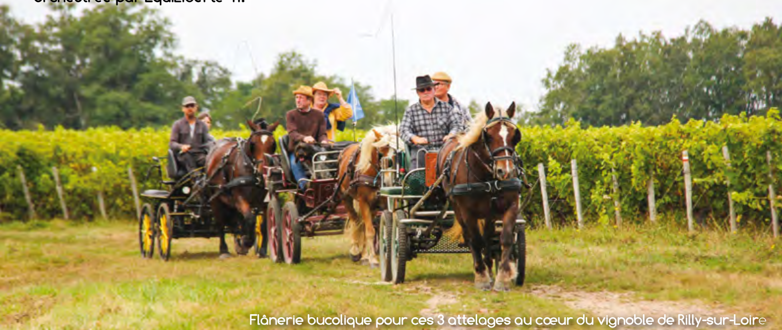
Flânerie bucolique pour ces 3 attelages au cœur du vignoble de Rilly-sur-Loire

À cheval, en voiture, randonnée Liberté en Val de Loire ! On ne présente plus la Fédération nationale "EquiLiberté" qui, forte de l'appui de ses relais départementaux, a fait du recensement, de la préservation et de l'entretien des chemins de randonnée, son cheval de bataille. Chaque année, nombreux sont les meneurs et cavaliers à découvrir à l'invitation de leur association départementale de nouveaux théâtres d'évasion pleine nature. Ainsi avec l'EQUI'Salamandre, randonnée de deux jours orchestrée par EquiLiberté 41.