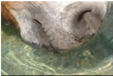
Fournir de l'eau fraîche à volonté

De l'eau de bonne qualité à disposition (E, A)